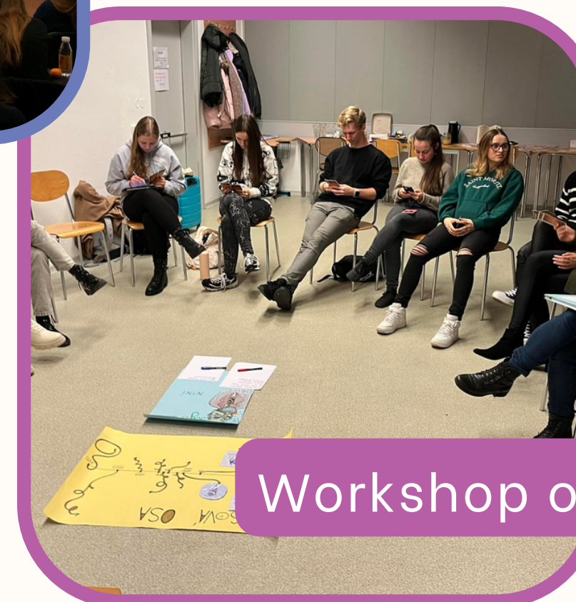
Workshop o Freudovi