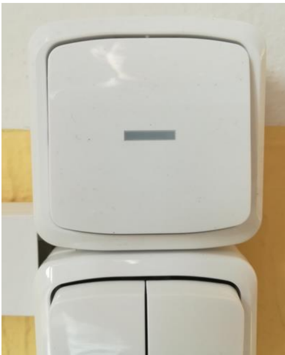
Obrázek číslo 1