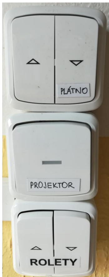
Obrázek číslo 1