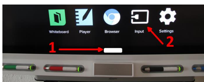
Obrázek číslo 3