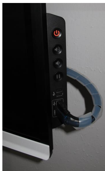
Obrázek číslo 2