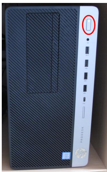
Obrázek číslo 1