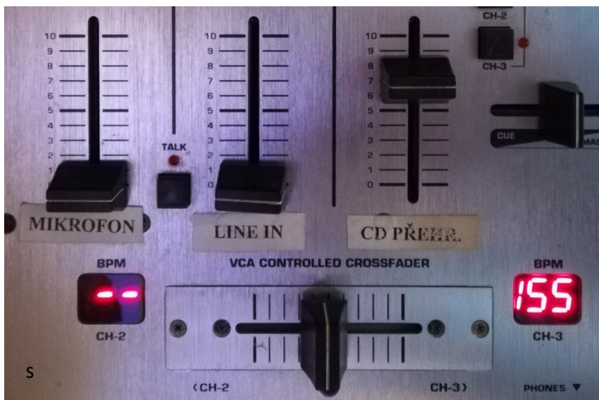
Obrázek číslo 3