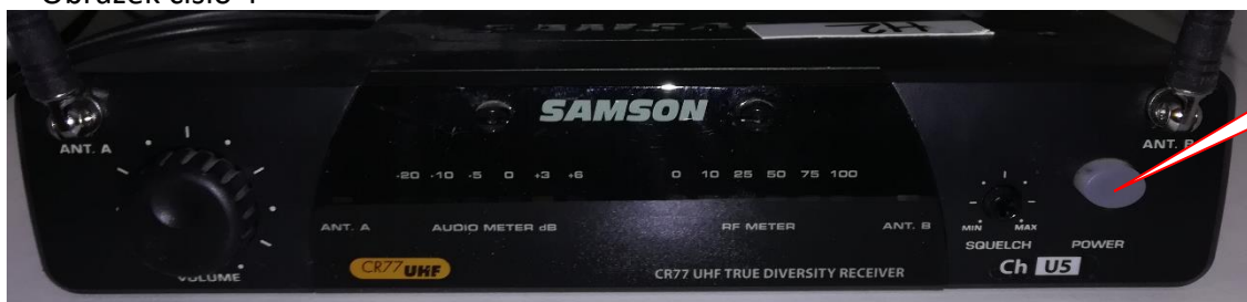
Obrázek číslo 4