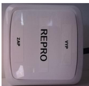
Obrázek číslo 1